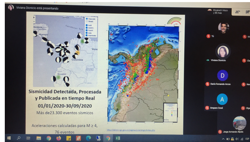
Imagen 2: Gobernanza en Gestión del Riesgo de Desastres / realidades y articulaciones de apuestas sectoriales multinivel.