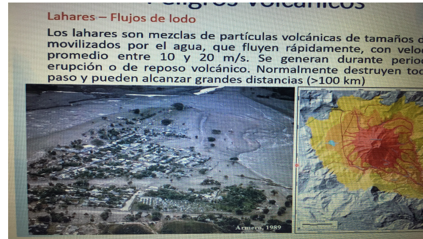
Imagen 1: Curso internacional online gratuito (gestión riesgo volcánico)